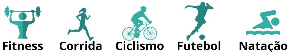
Figura 2: Ranking dos esportes mais praticados globalmente.